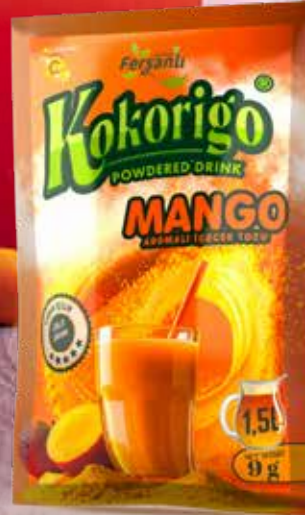
9g MANGO AROMALI İÇECEK TOZU