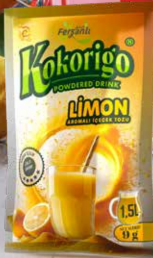
9g LİMON AROMALI İÇECEK TOZU