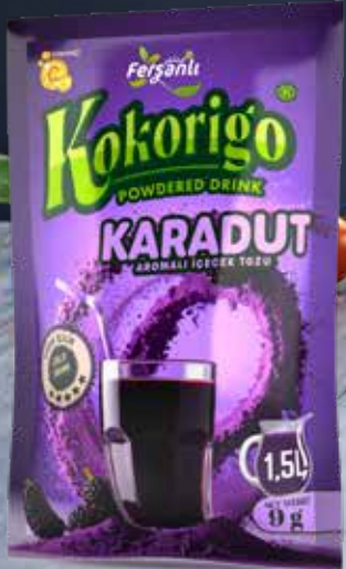
9g KARADUT AROMALI İÇECEK TOZU