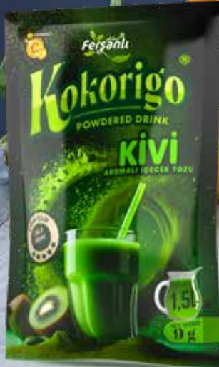
9g KIVI AROMALI İÇECEK TOZU