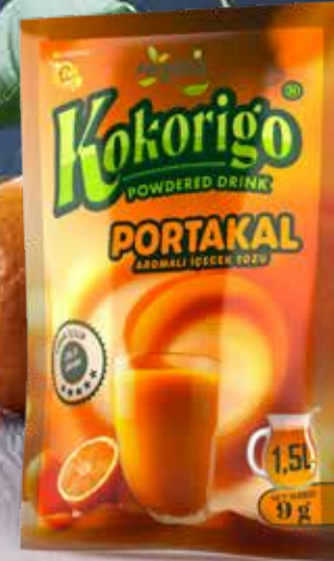
9g PORTAKAL AROMALI İÇECEK TOZU