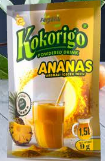
9g ANANAS AROMALI İÇECEK TOZU